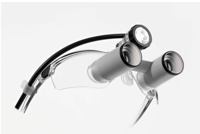
K bino TTL professional kikkertlupbrille med Saphiro 2

K bino professional kikkertlupbrille med Keplersk system er en tilføjelse til udvalget fra ZEISS. K bino professional kikkertlupbrille er det første Keplerske system fra ZEISS, som også fås med et sportsstel. Brugeren kan vælge imellem det klassiske STMS titanium-stel og det nye sportsstel.